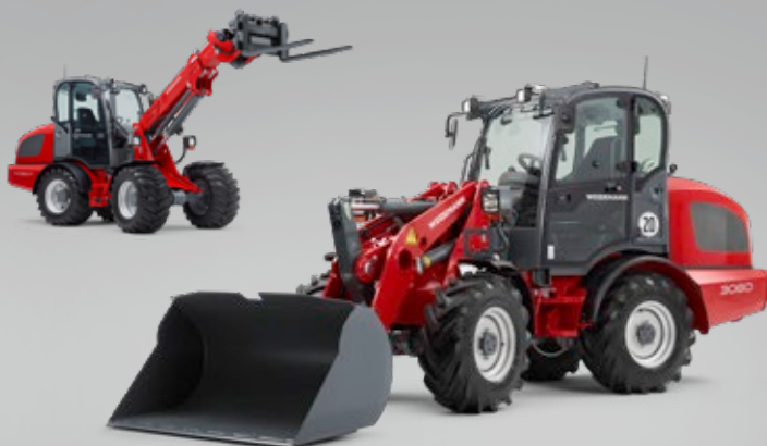
Die kraftvollen Radlader. Wahlweise mit Ladeschwinge oder Teleskoparm.