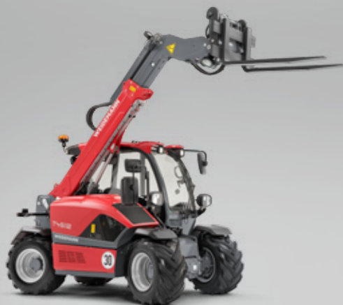
Die kompakten Teleskoplader. Hoch hinaus mit optimaler Standsicherheit.