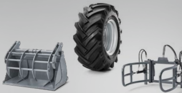
Anbaugeräte und Bereifung. Ihre Weidemann Maschine wird zum Multitool! Für jede Aufgabe das optimale Anbaugerät und die passende Bereifung.