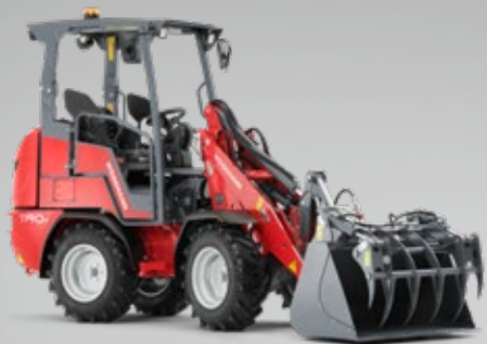
Die multifunktionalen Hoftracs®. Kraftvolle Helfer für jeden Einsatzzweck.